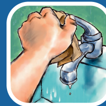
Sèvi ak sèvyèt pou fèmen wobinèt la

Se men pwòp ou yo ki responsab pou w gen bon sante.