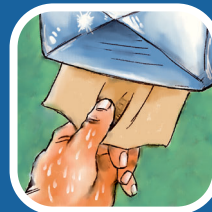
Chùi khô với khăn giấy