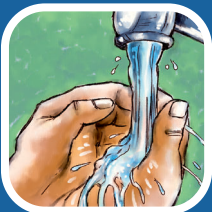
Dội nước cho tay ướt

Dùng loại xà bông thường. Xà bông chống vi khuẩn thì không cần thiết. Các loại xà bông này chỉ giết vi khuẩn, nhưng xà bông chống vi khuẩn có thể gia tăng vấn đề về sự chịu đựng thuốc kháng sinh.