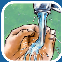
Dội nước cho sạch