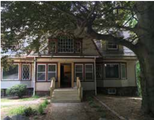
Project Rebound Boston, MA